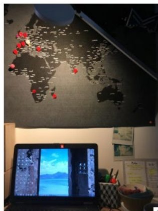
8h44 le 7 avril : mon nouveau bureau depuis 3 semaines !! Avec une vue sûres prochaines destinations quand on pourra reprendre l'avion ?