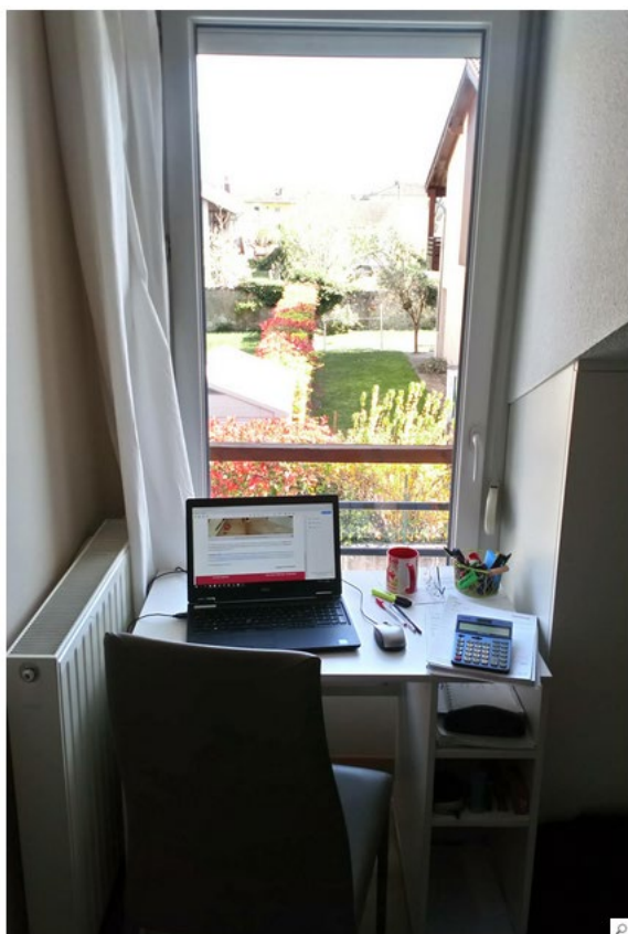
14h45 le 6 avril : le bureau de collégien qui rentre pile entre le radiateur et le placard, vue sur le jardin du voisin